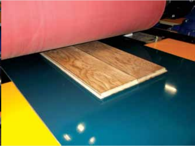
ROLL COAT MERDANE LAKLAMA ÜNİTESİ