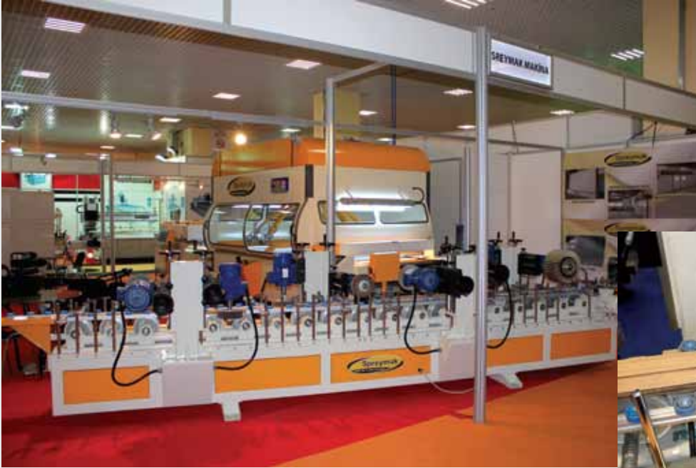
8x250 Profil Zımpara Makinası