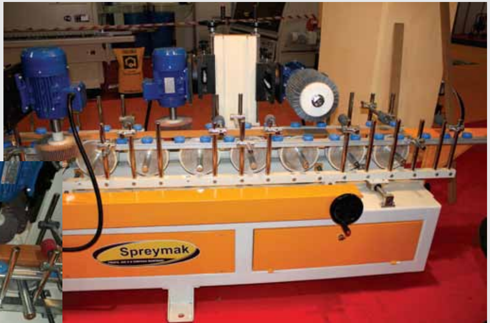
4x250 Profil Zımpara Makinası

Makinemiz ahşap, çelik, boru, plastik, kompozit ve benzeri malzemeler zımpara yapmak için geliştirilmiştir. Makinemizde ki 8 ve 4 adet üniversal hassas hareketli kızak sayesinde malzemenin her noktasını zımpara yapabilmeye özelliğine sahiptir. Zımpara motorları İleri-geri çalışır. Bu sayede malzemenin özelliğine göre hız ayarlaması yapılabilir, kolay ve hassas ayarlama yapılabilir.