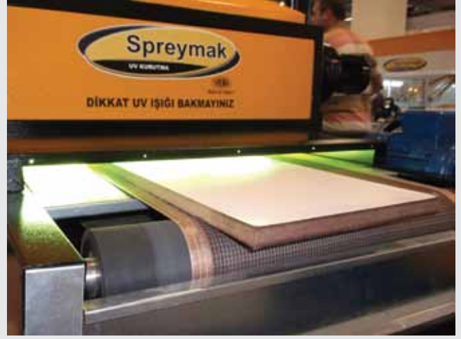
UV KURUTMA ÜNİTESİ